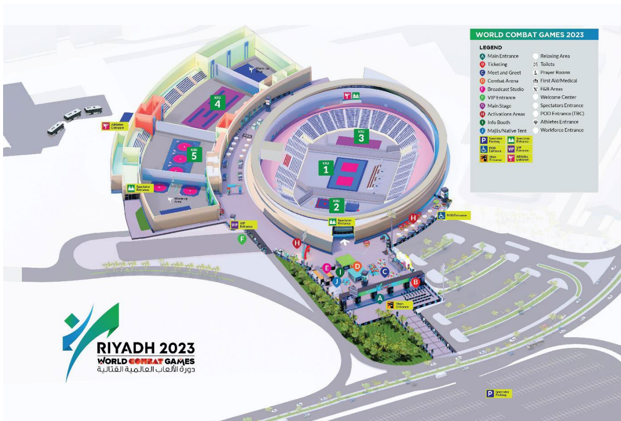
King Saud University Indoor Stadium (KSU)

Es gab noch eine offizielle Schlusszeremonie der WCG. Da wir unseren Rücktransport zum Hotel hatten, konnten nicht alle dabei sein. Bereits um 22 Uhr ging es zum Flughafen.