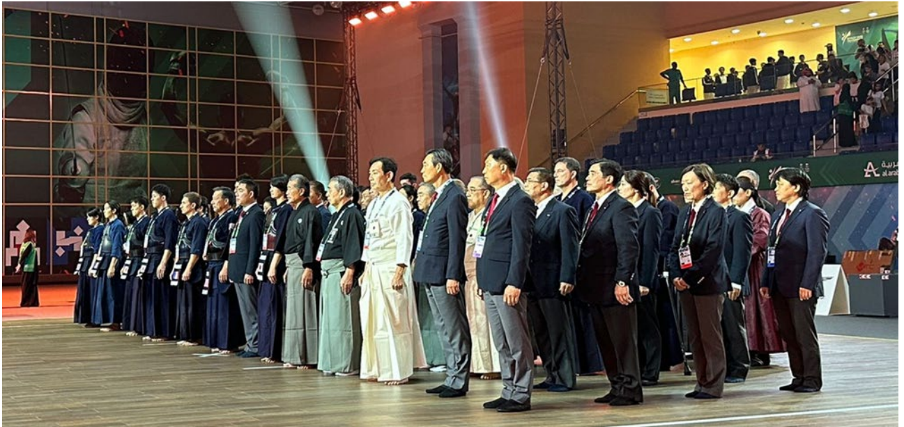
Eröffnungszeremonie in der King Saud University (KSU).

Alle Sporthallen waren sehr gut ausgerüstet. Der verlegte Spezialboden war top, ausser der Warm-up-Bereich, der war ziemlich rutschig.